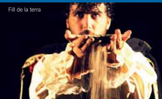
Fill de la terra

► A L'Avenç Centre Cultural se li ha girat feina per a aquest mes de març. I és que l'escenari de la sala teatre Joan Brillas acull una proposta per a cada cap de setmana. El primer torn és de l'Esbart Sant Martí de Barcelona i l'espectacle Fill de la terra (diumenge 9), una versió ballada de la llegenda del Comte Arnau en què el mític personatge català serà condemnat a ballar eternament per pagar els seus pecats. Aquesta adaptació dels textos de Josep Maria de Sagarra forma part de la programació de l'Espai A, el circuit d'arts escèniques amateurs que des del 2011 nodreix d'actuacions interessants els diversos ateneus de Catalunya.