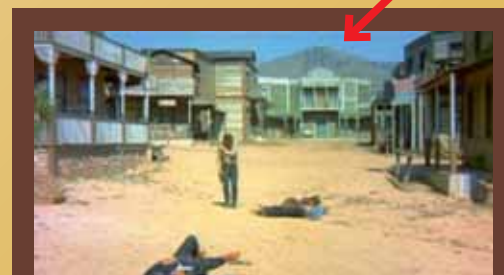
Seqüència d'un western on es pot veure l'emissora de Sant Pere Màrtir

La celebració no ha fet més que arrencar. Rescateu els barrets de cowboy de l'armari perquè, al llarg de l'any, us faran servei. Com, per exemple, durant la Festa Major, quan el Mercat Medieval es reconverirà en l'escenari d'un autèntic western . ●